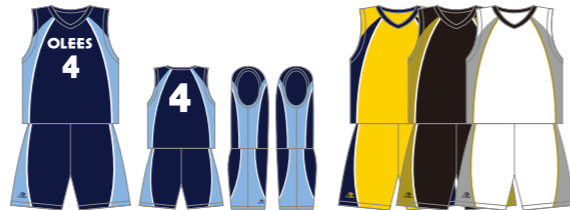
P-B6 脇カーブラインB型