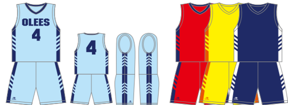
P-B1 脇ストレートラインA型