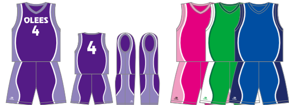
P-B2 脇カーブラインA型